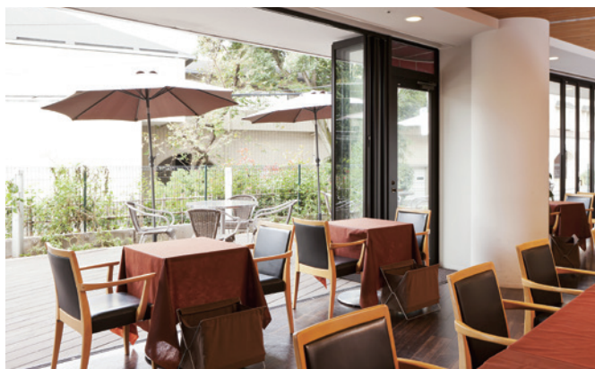
※敷地内レストラン「ニュートゥモローカフェ」