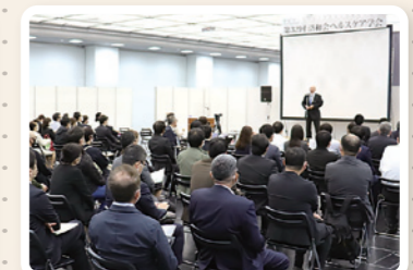
洛和会ヘルスケア学会