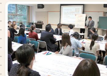
フォローアップ研修

入社後、新入職員全員で合宿研修へ行きます。期間中は研修だけでなく、レクリエーションなどを通して、職種や年齢を超えた、同期とのつながりを深めます。