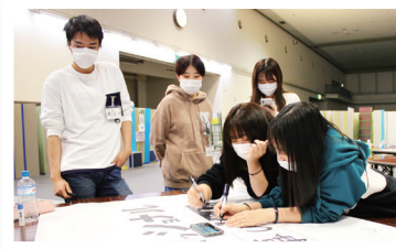
写真は2022年 新入職員研修 の様子

お姉さん制度とは、新人職員(プリセプティ)一人に対して、決められた先輩指導者(プリセプター)がマンツーマンで支援する制度です。先輩が新人職員とペアを組み、現場での指導やフォロー、メンタル面でのサポートを担当しており、安心して何でも相談できる存在です。さらにそのペアを所属部署全体でバックアップし、安心して働ける職場をつくります。